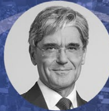
Joe Kaeser Vorsitzender des Vorstands Siemens AG